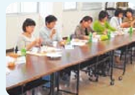
【地産地消意見交換会の様子】