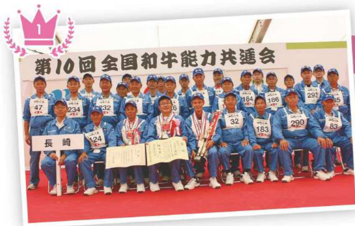
日本一になった生産者のみなさん