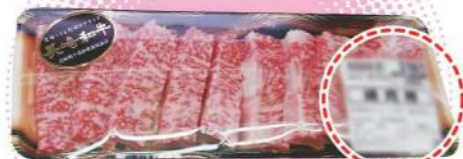
販売されている牛肉