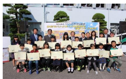
受賞者の集合写真