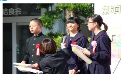
受賞者ヘインタビュー