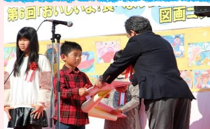
審査員長からの表彰状

※令和3年度の表彰式は中止（予定）。 受賞者には学校を通して表彰状と副賞を贈呈いたします。また、参加賞についても例年どおり学校へ発送いたします。