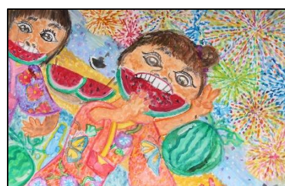
小学生部門（高学年の部）